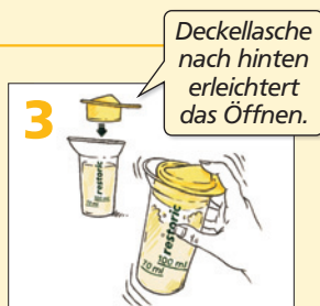
Schütteln, bis sich das Pulver vollständig gelöst hat